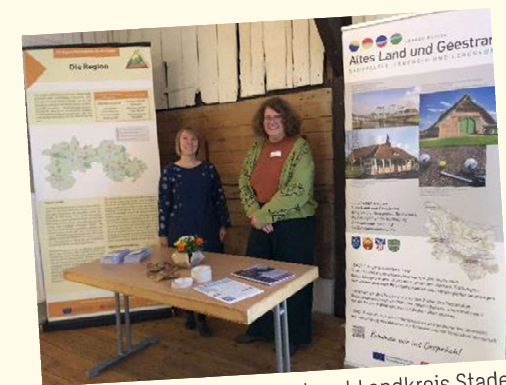
04.04. Tourismusverband Landkreis Stade