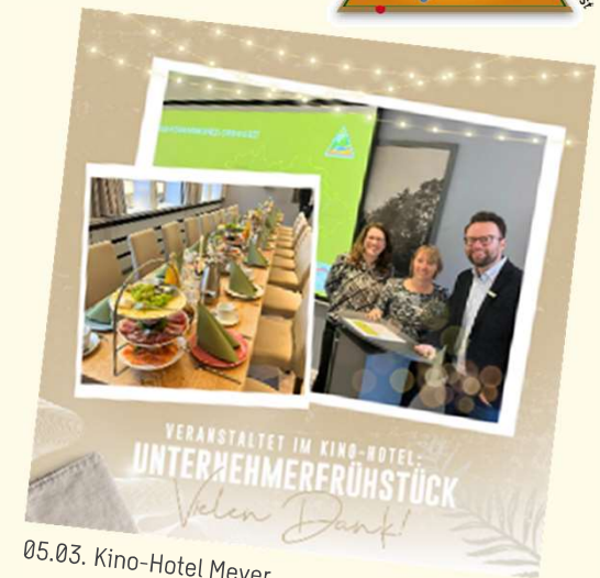
05.03. Kino-Hotel Meyer